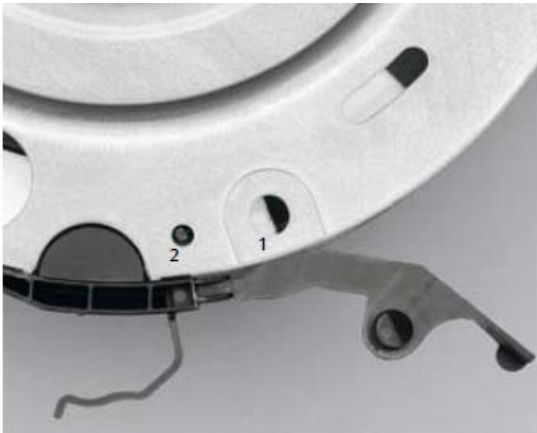
Attrezzo per sostegno radiale dell'unità frizione