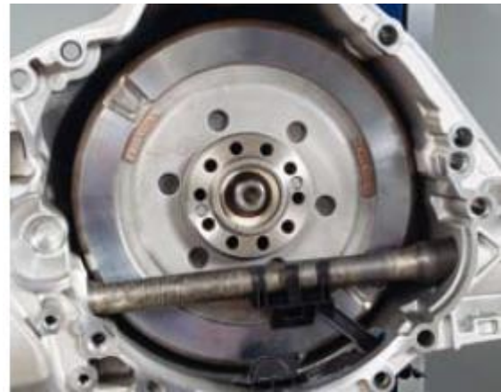
Attrezzo da inserire sull'asse delle ruote motrici per sorreggere assialmente l'unità frizione.