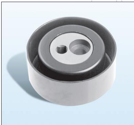
Rullo di scorrimento in metallo

Tutte le altre caratteristiche tecniche rimangono invariate.