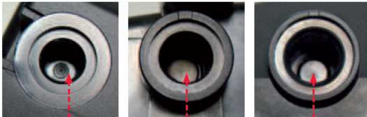
Fig.1 KL 418

Alcuni filtri gasolio con involucro in plastica posseggono un foro filettato "cieco" necessario per l'eventuale montaggio del rilevatore di acqua.